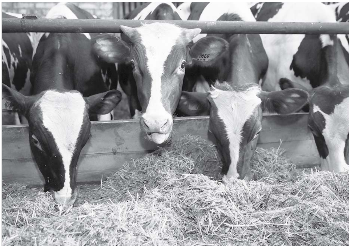
В 2004 году 4000 кг молока в год на корову в крае считались хорошим результатом, сейчас средний надой составляет 7500 кг.