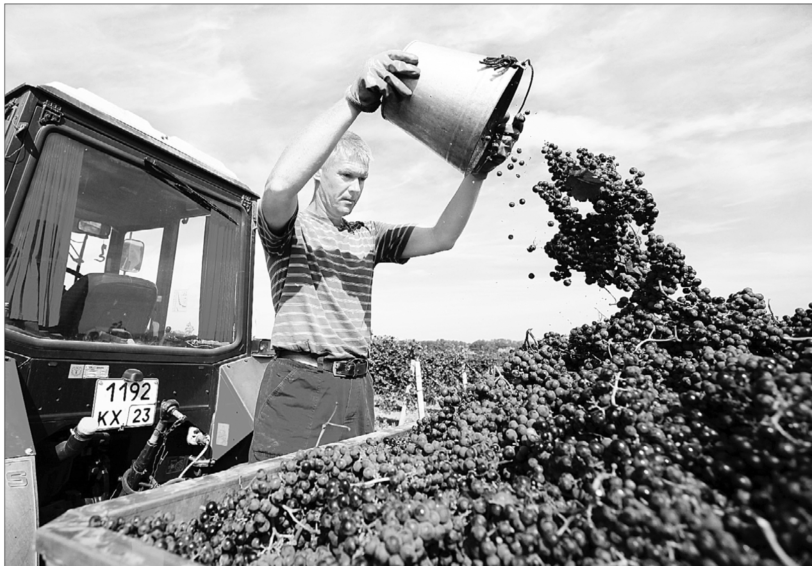
Виноградари Краснодарского края собирают по 100 и более центнеров ягоды с гектара.

В планах краевых аграриев: посадить виноград на всех подходящих для него землях. Для этого нужно закладывать в ближайшие годы по две тысячи гектаров.