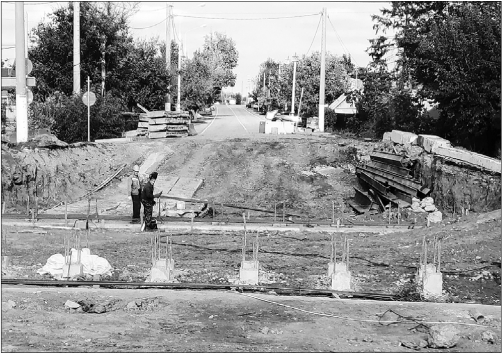
Возможно, в Новый год прокатимся по новому мосту.