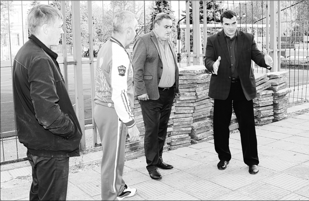
При подготовке к укрепительным работам под фундаментом спортшколы «Юность» важно не упустить ни одной детали проекта.

Пешеходные дорожки уже подготовлены к укладке плитки, бордюры установлены, и