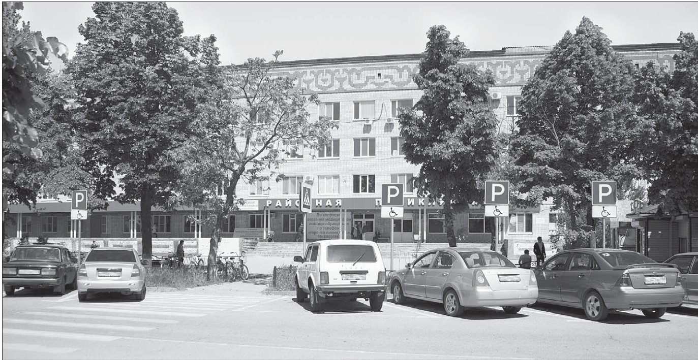
📷 Водителям, которые паркуются на «зебре», не стоит, в первую очередь, забывать о пешеходах, а кроме того, за это грозит штраф.

Присылайте ваши новости, фото и видео 8-918-333-91-08 (WhatsApp)