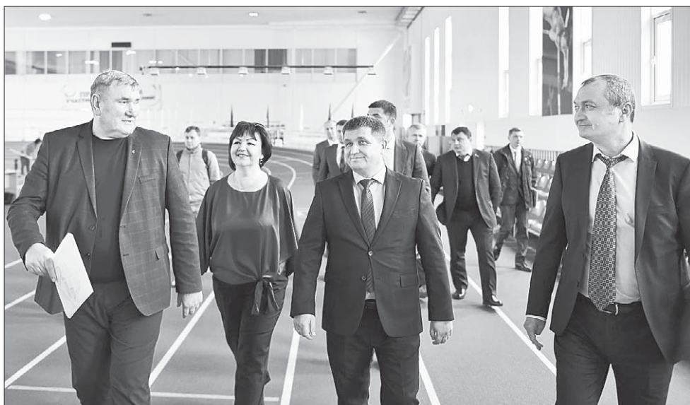
Александр Власов: «Кубань - один из лидеров страны по уровню вовлеченности жителей в занятия спортом» (во время рабочей поездки в Славянский район).

фраструктуры в муниципальных образованиях сегодня ведется в соответствии с краевой Стратегией развития физкультуры и спорта. Она принята до 2030 года, действует как в рамках федеральных и государственных программ, так и по регпроекту «Спорт - норма жизни».