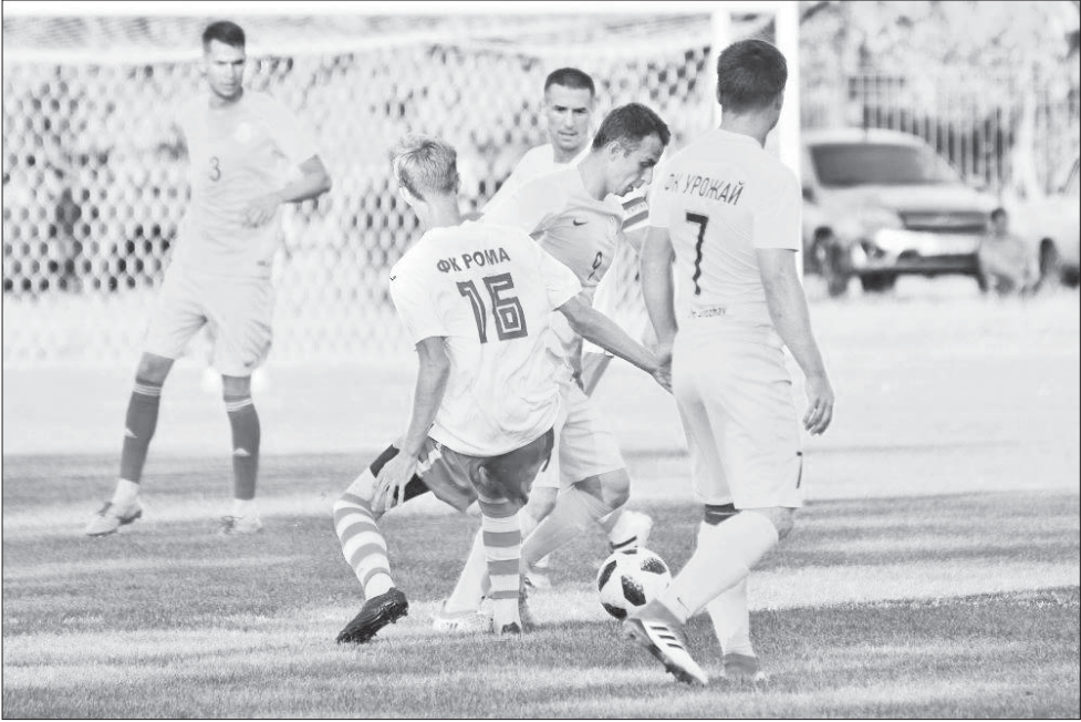
Дополнительные три очка ивановцам принесла победа над трудобеликовским ФК «Рома».

Красивая игра прошла также между марьянским «Стандартом» и полтавской «Дружбой». В гостях футболисты из районного центра победили