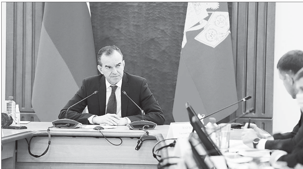
📷 Реализация плана развития и господдержки реального сектора экономики - на постоянном контроле у главы региона.

Дает положительную динамику предприятие тяжелого машиностроения в Краснодаре, которое вдохнуло «вторую жизнь» в знаменитый, но обанкротившийся завод имени Седина. Совместными усилиями нам удалось сохранить «сединскую» инженерную школу и мощную производственную базу. Теперь завод освоил линейку существующей продукции,