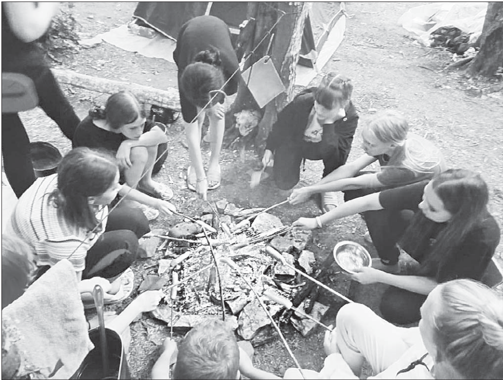
Сосиски, обжаренные на разведенном самими же ребятами костре, приобретали удиви- тельный вкус.