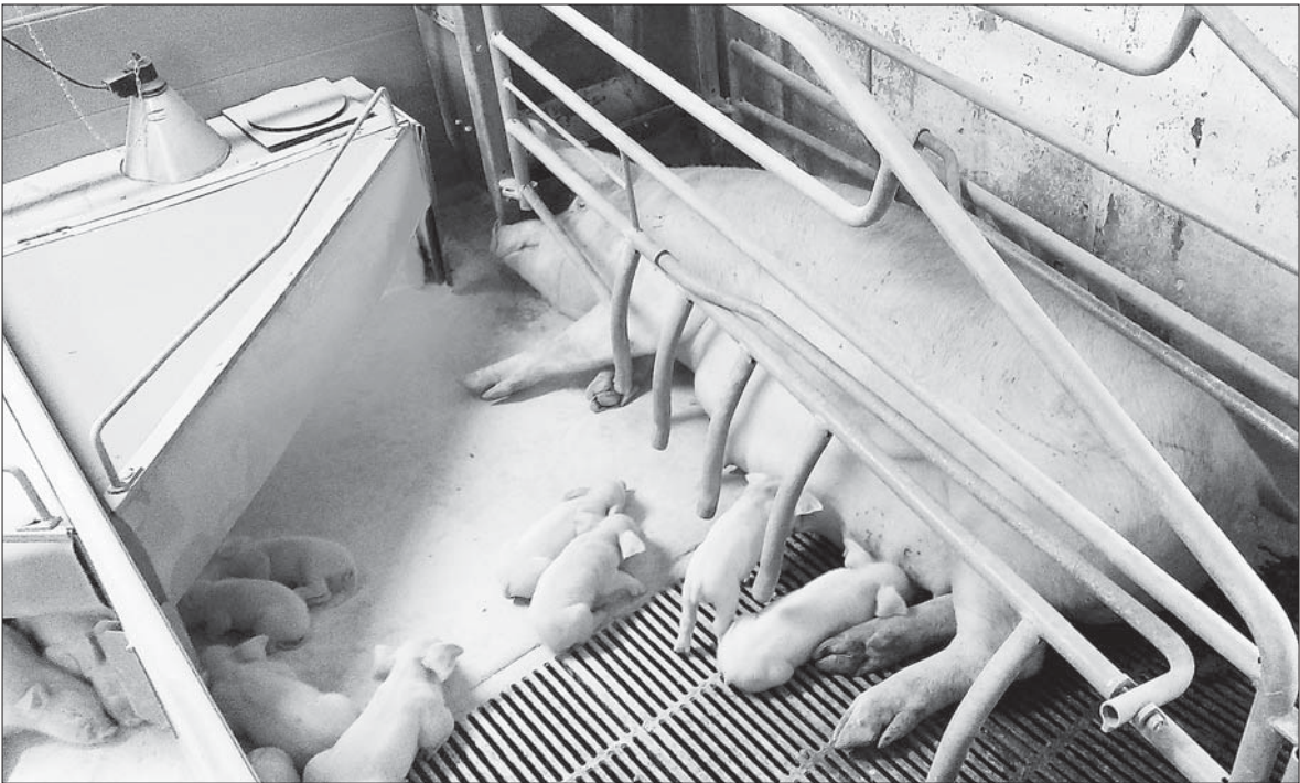
«Маркор» - третий проект по производству свинины в нашем районе. Предыдущий - предприятие «Данкуб» - разорилось после потерь от вспышки АЧС.

На самом производстве санитарно-эпидемиологические правила были возведены в безоговорочную степень исполнения. В соответствии с приказом Минсельхоза РФ №258, предприятие вышло на самый высокий уровень защиты - компартмент IV. Он подразумевает безвыгульное содержание свиней, ежедневную обработку