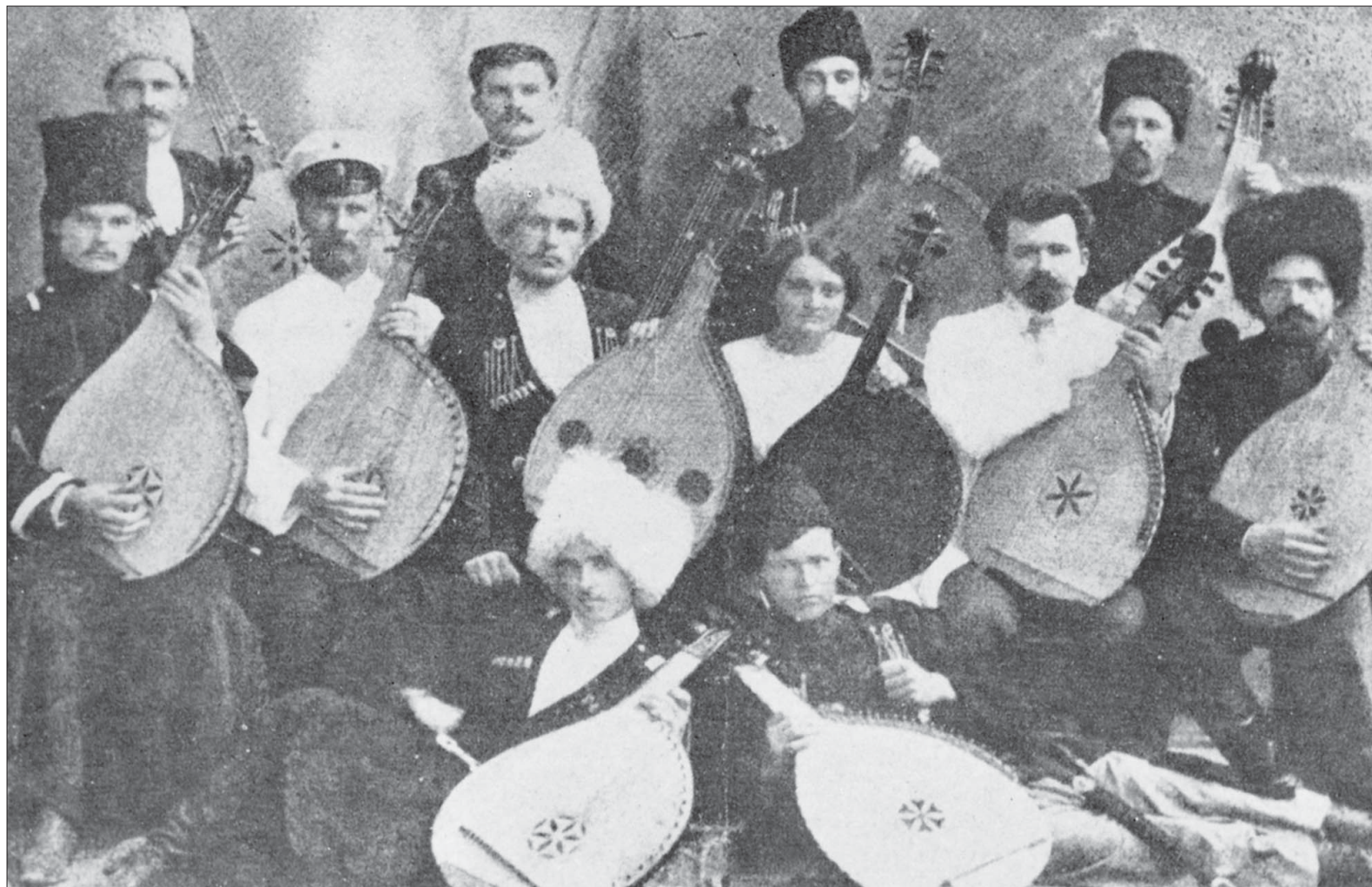
Первый выпуск Первой школы бандуристов, г. Екатеринодар, 1913 год.