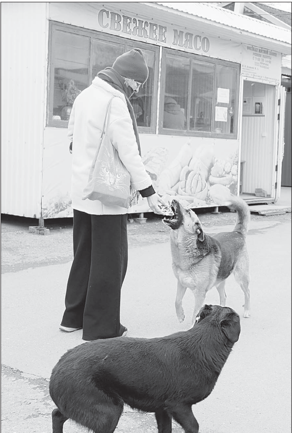
Хоть закон и не запрещает кормить животных в общественных местах, лучше не делать этого, к примеру, посреди рынка, в окружении людей.

Так что теперь кормить кошек и собак в общественных местах можно.