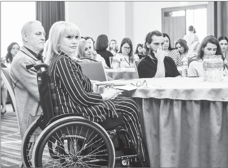
Проведение форума инклюзивного предпринимательства возможно благодаря нацпроекту «Малое и среднее предпринимательство и поддержка индивидуальной предпринимательской инициативы».

Мотивация. Инклюзивное предпринимательство на Кубани развивается благодаря эффективным мерам господдержки