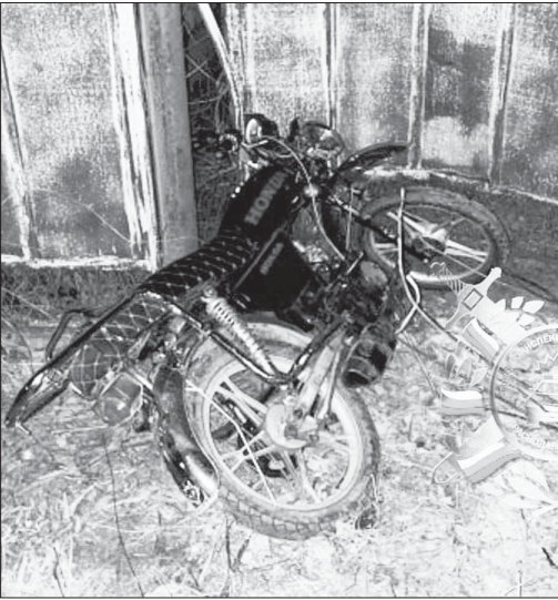
Юный мотоциклист чудом избежал печальных последствий.

Одно из них вечером 2 марта зафиксировала камера видеонаблюдения в станице Полтавской, на улице Таманской. Судя по кадрам, мотоциклист прилично разогнался и слетел со своего железного коня. В местном отделе ГИБДД «Голосу правды» рассказали, что обращений по этому инциденту не было. Так что, вероятнее всего, мотоциклист поехал дальше. 3 марта, в 18:20, произошел случай посерьезнее. В станице Ивановской, на улице Ленина, пострадал 16-летний водитель мопеда. Он не справился с управлением и врезался в забор. Парень получил телесные повреждения. Материалы по факту управления мопедом несовершеннолетним переданы в КДН, сообщает районная Госавтоинспекция.