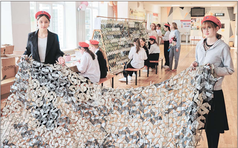
Учащиеся СОШ №5 плетут маскировочные сети на уроках труда, во время перемен и в любое свободное время.