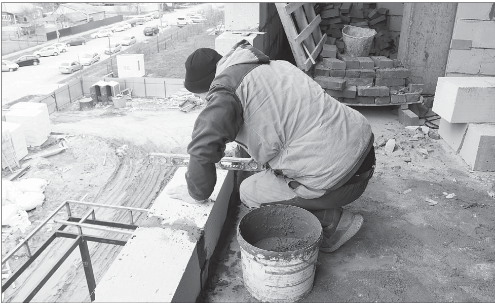
В среднем 45-50 рабочих ежедневно трудятся на строительстве детской районной поликлиники./ Фото Юлии Карпенко.

На сегодняшний день, как сообщается в официальном тг-канале администрации района,