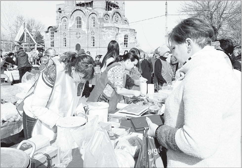
Плов и шашлык, приготовленные на костре, пользовались большим спросом у посетителей ярмарки.

Для СВОих. Марьянцы снова показали пример всему району