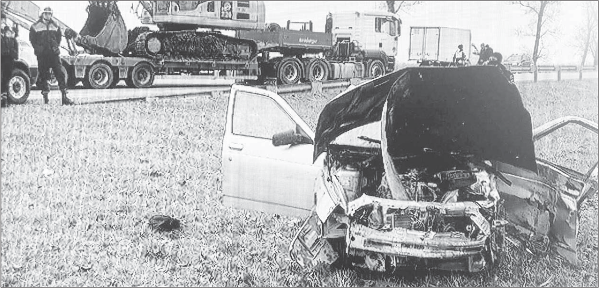
После столкновения с грузовиком легковой автомобиль вылетел с проезжей части.