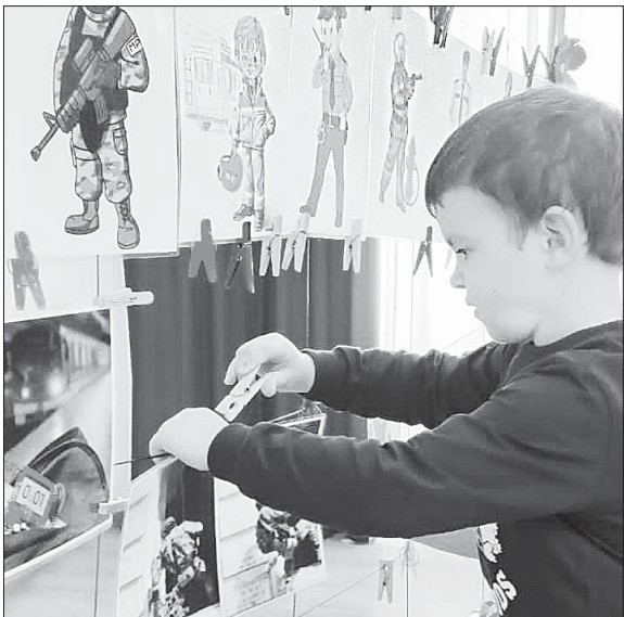
Дети в игровой форме знакомятся с основами безопасности.