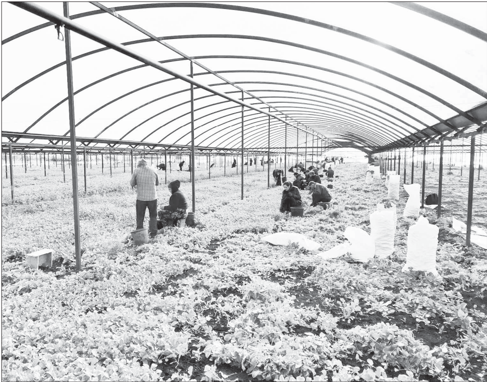
Крупный тепличный комплекс по выращиванию редиса в пригороде Кропоткина.