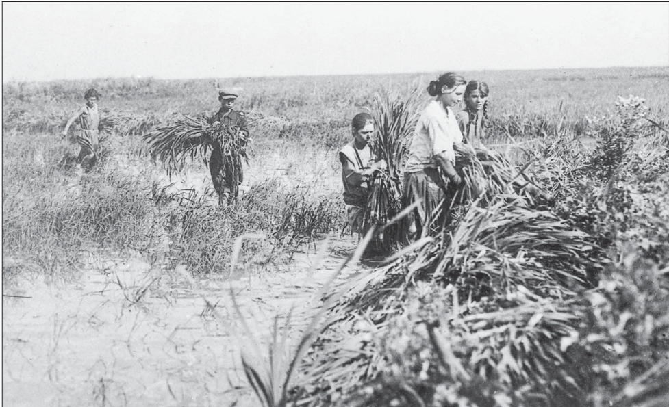
📷 Прополка риса во все времена была наиважнейшим делом.

«За досрочное выполнение плана весеннего сева и хоро-