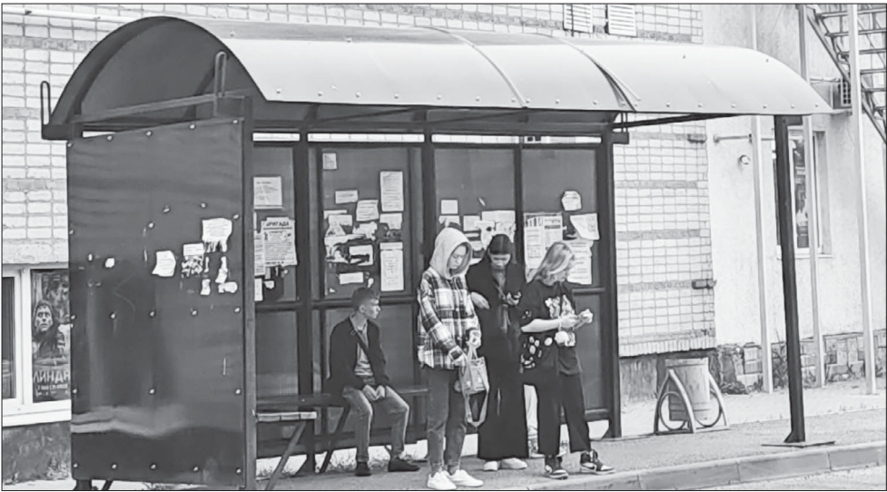
После майских праздников все муниципальные маршруты вернутся к своему обычному графику.

На маршруте №103 (Полтавская-Трудобеликовский) с 28 апреля по 14 мая будет работать один автобус по воскрес-