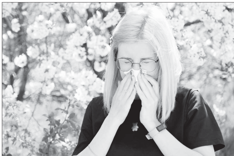
Во время цветения деревьев врачи рекомендуют аллергикам ограничить прогулки на свежем воздухе, особенно в солнечную, сухую и ветреную погоду, когда концентрация пыльцы может достигать высоких значений.

Что происходит в организме аллергиков, когда весной расцветают растения? Аллерген попадает в виде пыльцы в наши так называемые «входные