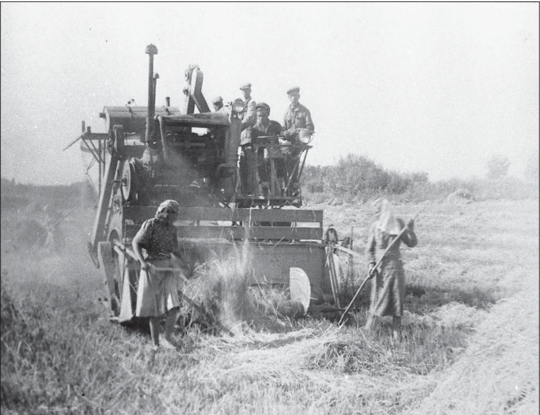
📷 Первые комбайны требовали участия в подборе валка сильных рук.