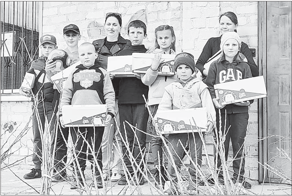
Воспитанники учебно-реабилитационного центра «Хрусталик» в городе Рубежное особенно рады были сладким подаркам от наших волонтеров.

По информации пресс-службы администрации района