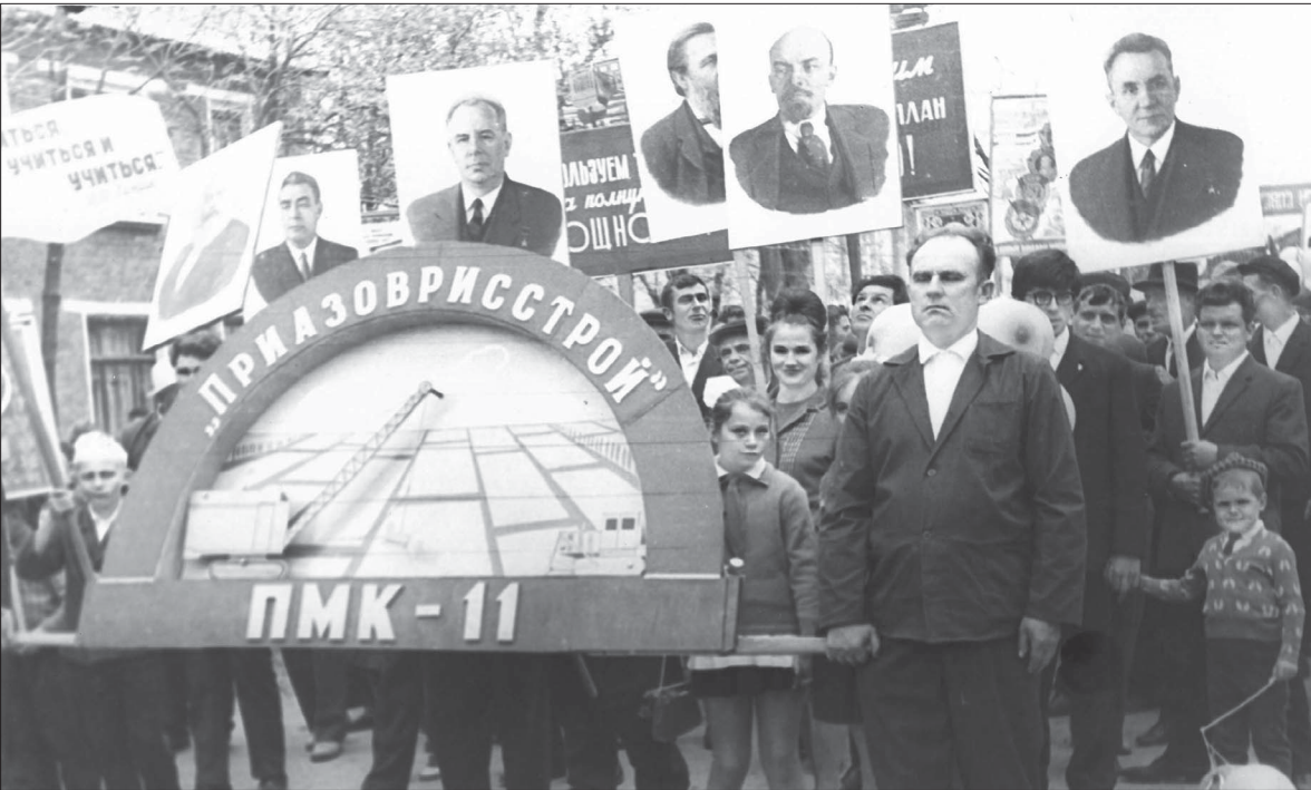
📷 Коллектив ПМК-11 вышел на Первомайскую демонстрацию в полном составе. Впереди шли передовики и ветераны механизированной колонны. За выдающиеся заслуги перед советским государством ПМК-11 была награждена орденом Трудового Красного Знамени.

Присылайте ваши новости, фото и видео 8-918-333-91-08