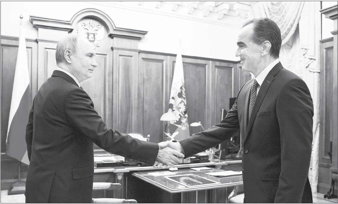
Владимир Путин поддержал решение губернатора переизбраться на новый срок.

Отдельно глава государства поинтересовался успехами социальной сферы - самой значимой для людей. Губернатор ответил, что благодаря нацпроектам многие из острых вопросов удалось уже решить. Но, объективно, есть еще проблемы. Как, например, вторая смена в школах. Не хватает кадров в ключевых отраслях, в