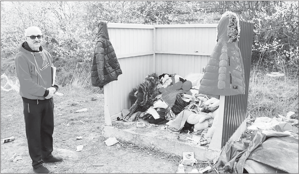
📷 Контейнерная площадка на отшибе улицы Передерия превратилась в склад мусора и подержанных вещей.

Народ и власть. Жители улицы Передерия в Ивановской требуют внимания, но власти считают, что на их запросы местный бюджет ответить не может