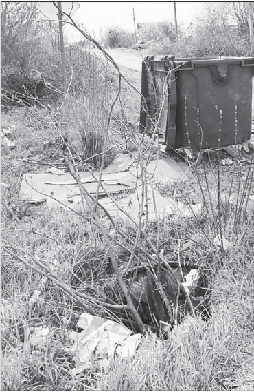
📷 А в таком состоянии находится пожарный гидрант.