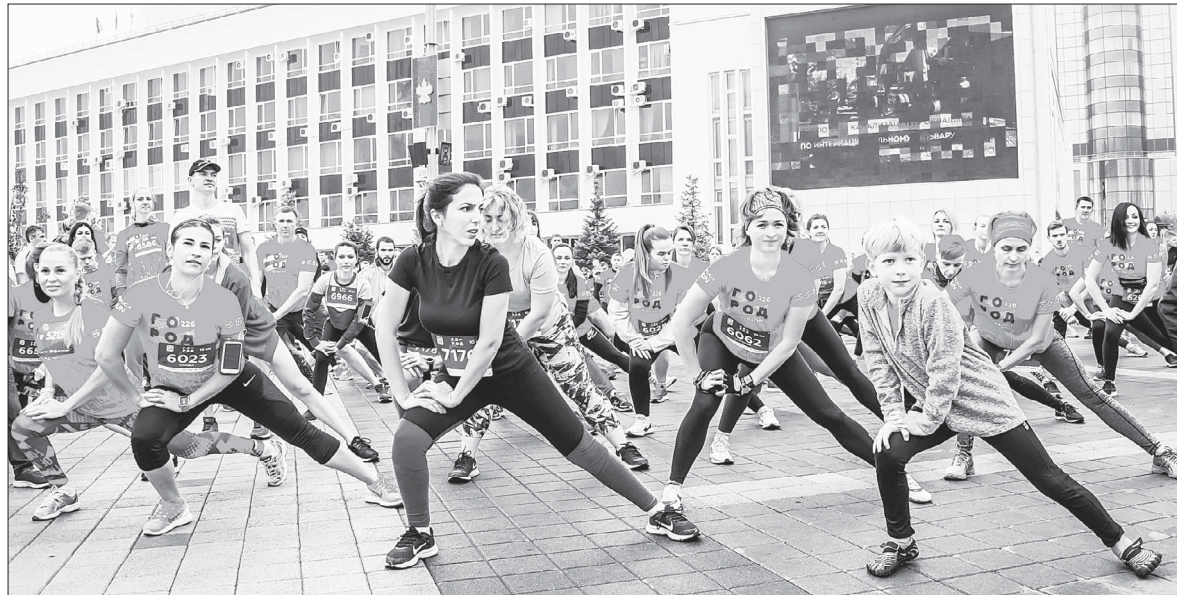
Занимайтесь спортом, активничайте, участвуйте в соревнованиях! И тогда ваш мозг не будет лениться.

Умные привычки. Наш мозг, как главный дирижер, контролирует все жизненно важные функции организма