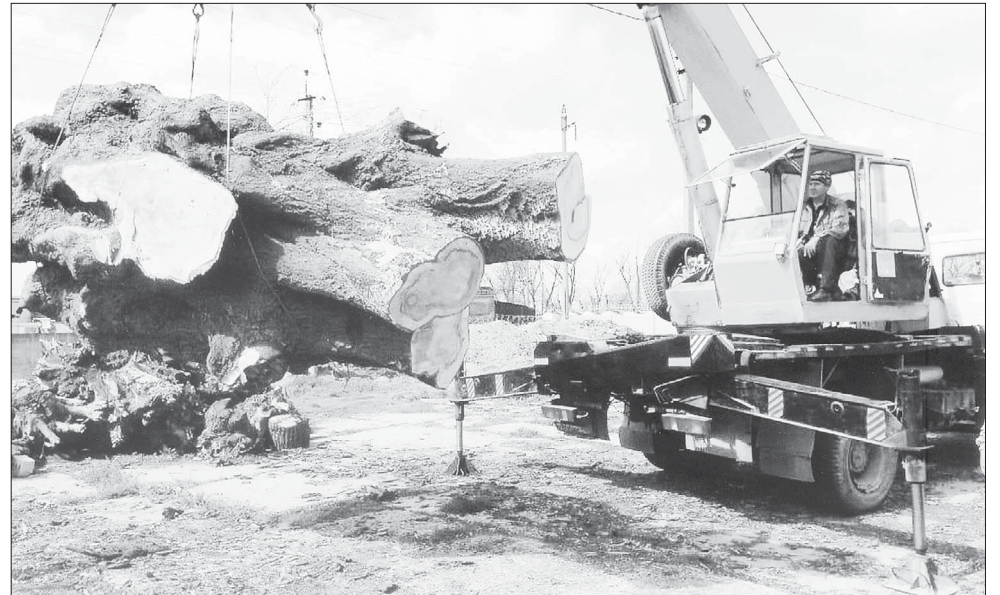
Даже тополь-великан крановщику подчинился.