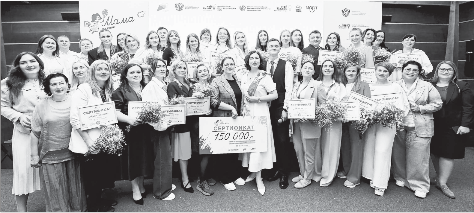
На фото участницы проекта «Мама на селе». Вон сколько настроенных на победу мам на селе! Это значит, что в хуторах и станицах будет открываться перспективный бизнес.

Инженерные профессии сегодня очень востребованы,