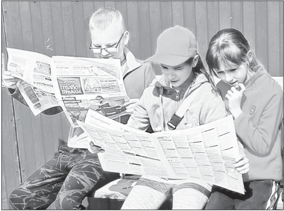
Все самые интересные новости о чрезвычайных событиях и красочных мероприятиях Красноармейского района читайте в «ГП».

для физлиц - 753 рублей, для юрлиц - 846 рублей.