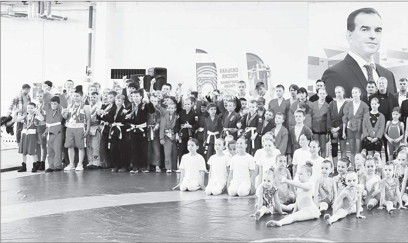
Открытие Центра единоборств завершилось общей фотографией - на память об этом дне, который вошел в спортивную летопись

Дождались. После нескольких переносов сроков сдачи