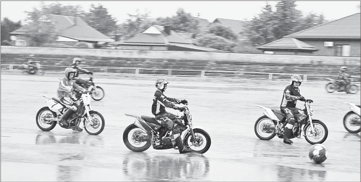
На мокром поле - настоящая битва. Матч «Кировца» против «Агрокомплекса» собрал десятки болельщиков, несмотря на ливень.

- У ребят есть стремление, - говорит директор одноимен-