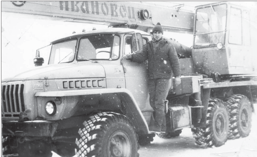
Работа на стройках Брянщины.