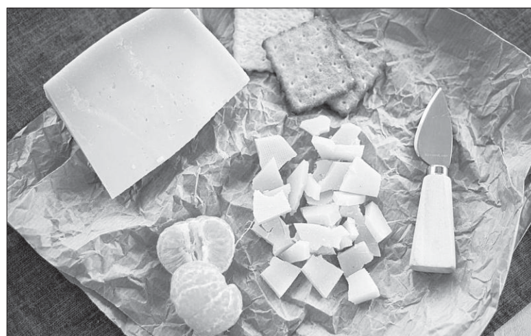
Агротуры с возможностью продегустировать продукцию сегодня на Кубани становятся очень популярными.

Продукцию можно найти не только в фирменных магазинах, но и на полках торговых сетей Краснодарского края. С 2019 года ее качество подтверждается знаком «Сделано на Кубани», что для покупателей является гарантией натуральности.