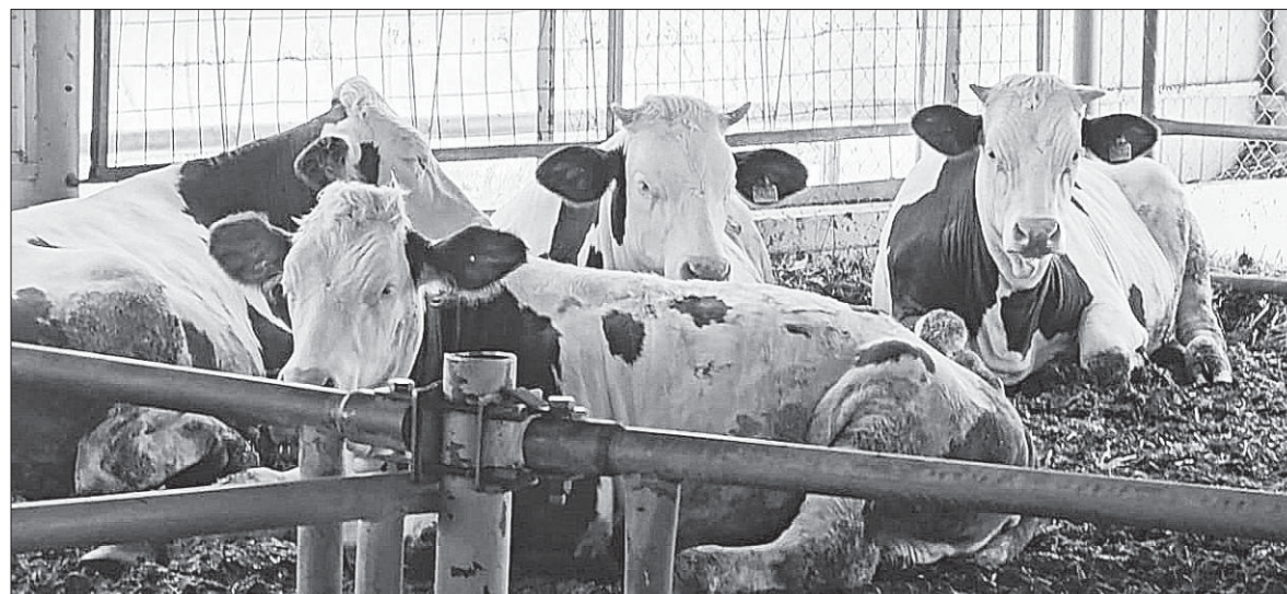
Коровы породы Монбельярд дают то самое идеальное молоко, из которого в сельхозкооперативе «Сырные истории» готовят разные виды сыров.

Стратегия бизнеса. Как благодаря объединению ресурсов и господдержке сельская кооперация становится драйвером роста агропромышленного комплекса края