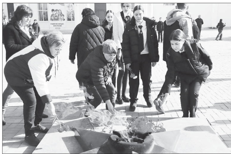
В памятный день в хуторе Трудобеликовском собрались на площади представители власти, духовенства, учащиеся школы и техникума, казачество, местные жители, чтобы почтить память погибших солдат.