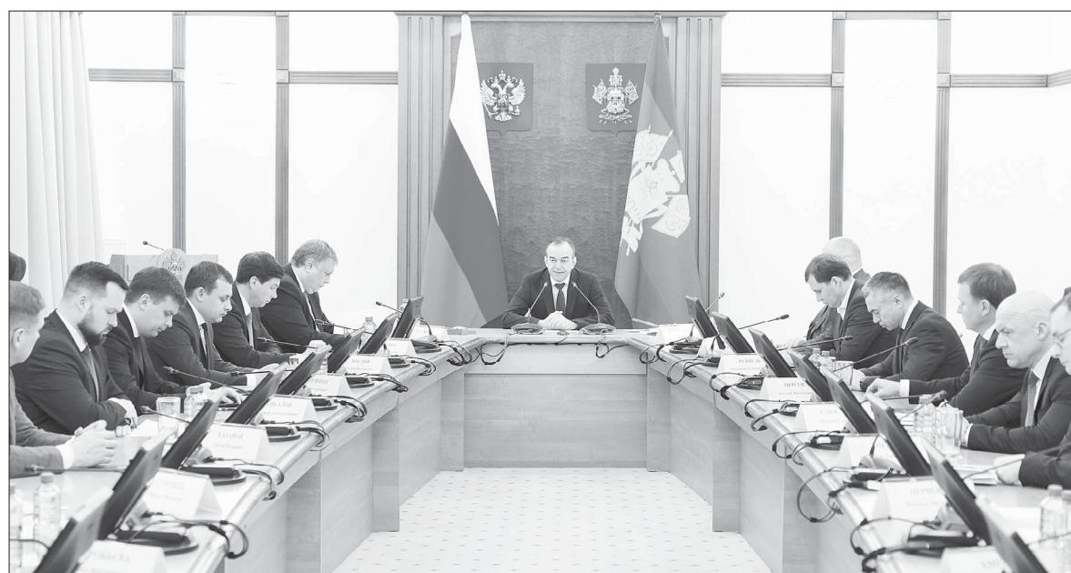
Равнодушие недопустимо, школа - второй дом, а значит и питание у детей должно быть вкусным и качественным, отметил Вениамин Кондратьев.

Губернатор Кубани провёл совещание по качеству питания в образовательных организациях