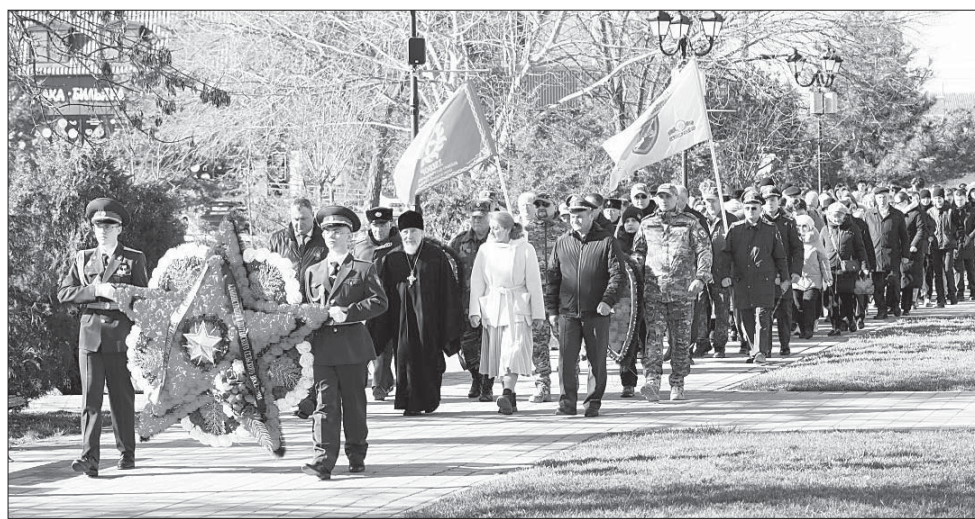
На митинге в честь освобождения станицы Красноармейской (ныне Полтавской) собралось много местных жителей.

Даты. В сельских поселениях прошли митинги в честь 83-й годовщины освобождения от немецко-фашистских захватчиков