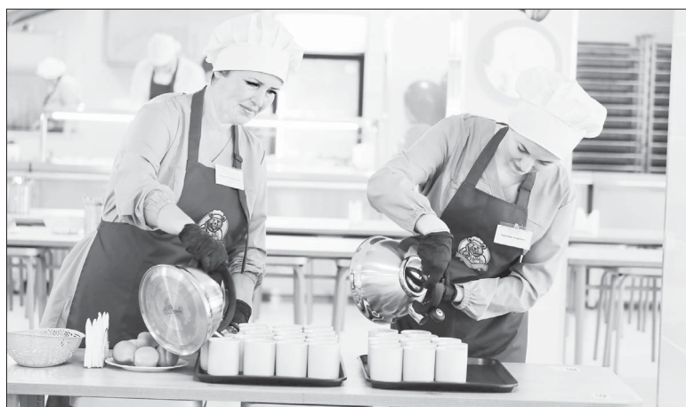
Вопрос организации питания контролируется особо тщательно.

Замруководителя краевого Роспотребнадзора Надежда Перякина сообщила, что все