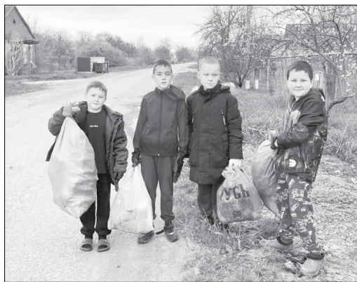
Юные жители хутора Колос навели порядок на улицах, подав пример взрослым.

Администрация поселения поблагодарила мальчиков за доброе дело, а их родителей - за правильное воспитание детей. Ребята признались, что субботник для них - это не только уборка территории, но и общение, хорошее настроение и прогулка с пользой.