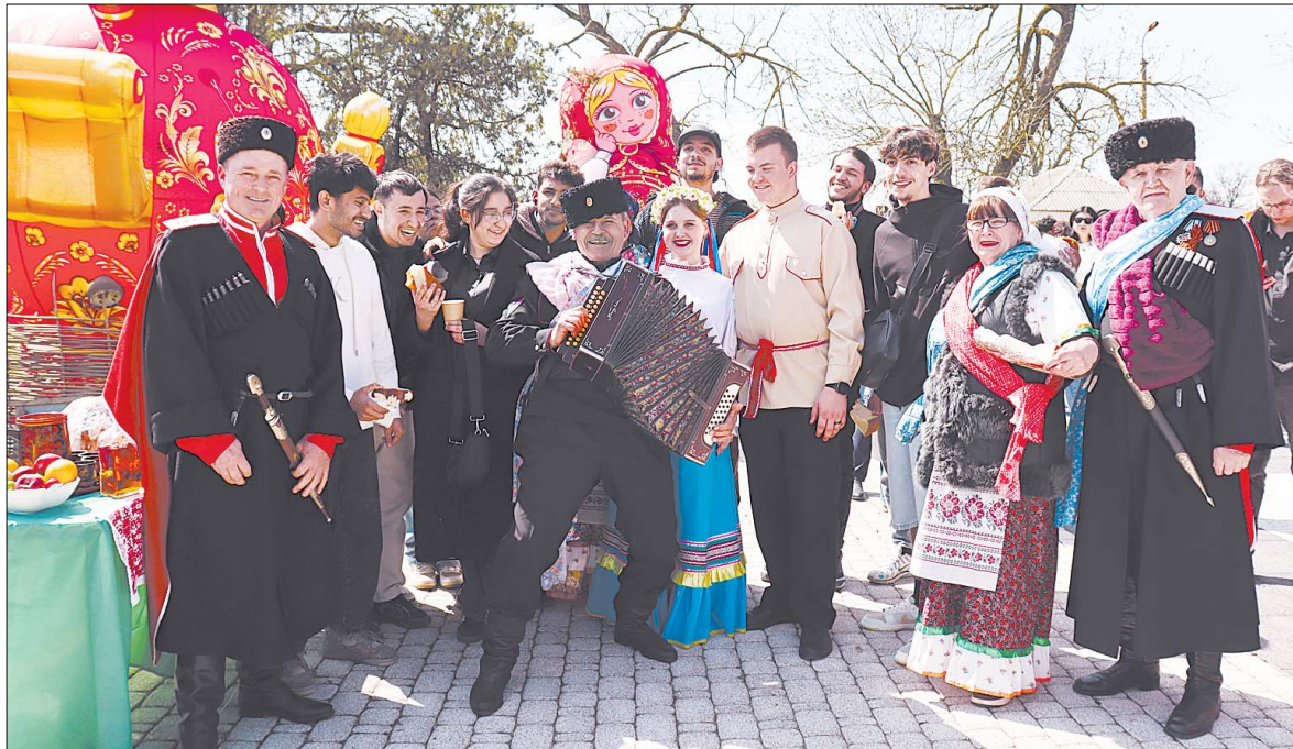
Тут-то и выяснилось: самый главный музыкальный инструмент на гулянье - гармошка.