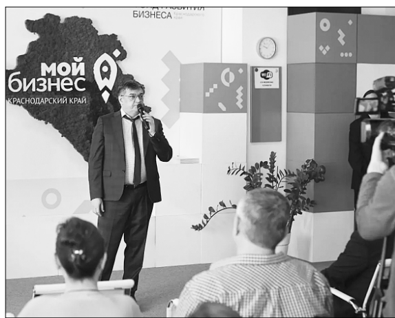
«СВОй бизнес» - это фактически дорожная карта господдержки проектов ветеранов СВО и участников боевых действий, а также членов их семей.