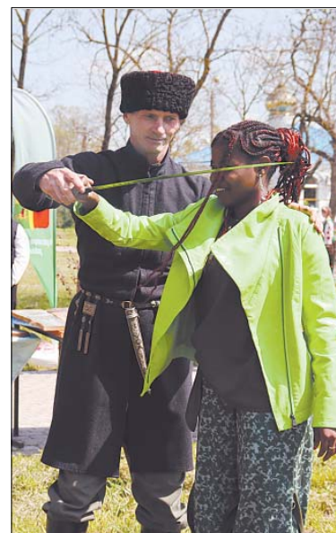
Руби с плеча.