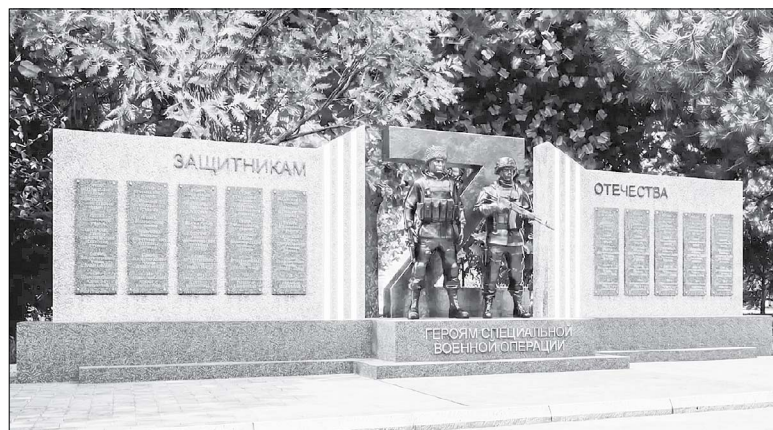
Вот такой монумент в память о наших героях в этом году появится в станице Полтавской.

- Это будет не просто монумент, а место встречи с судьбами наших Героев. Место, где