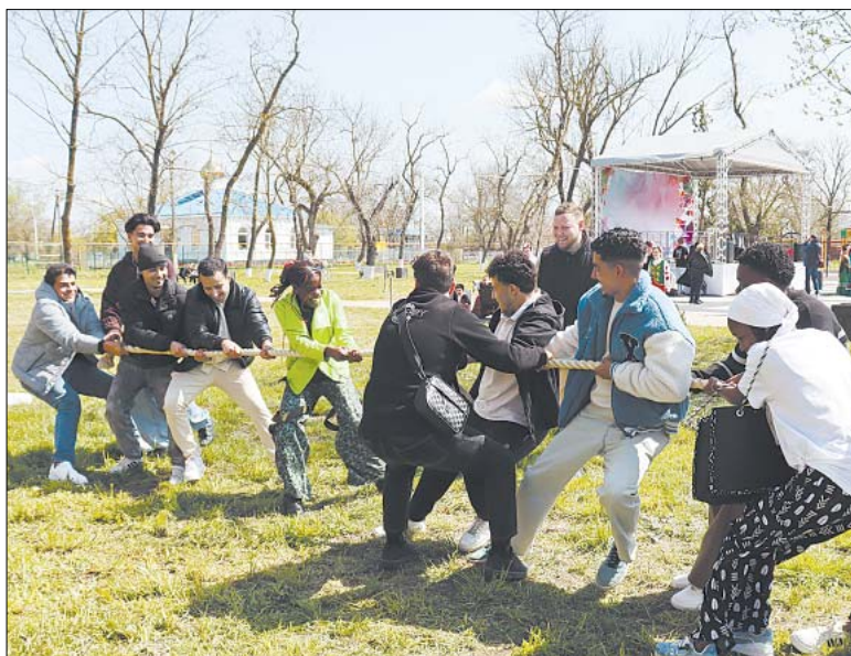
Догадаться нетрудно: здесь победила дружба.

«Фраза из фильма «Танцуют все!» - как нельзя лучше подходит к празднику в Староджерелиевской. В пляс пошли и кубанцы, и африканцы, и еще представители трех десятков стран. А все почему? Потому что танец - выразитель настроений всех народов.