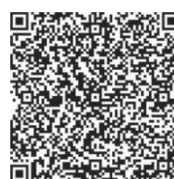
График вывоза мусора в станице Полтавской

В мае в станице «Экотехпром» планирует замену почти 400 железных контейнеров на пластиковые.