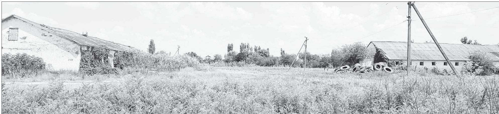
Вот так выглядит заброшенная ферма за околицей поселка Краснодарского. Чем не обитель для семейств лис?

Здесь мы каждую неделю рассказываем о героях дня, героях нашего времени, других интересных или необычных людях, которые живут рядом. Если вы хотите поделиться историями о ваших земляках - напишите на whatsapp, по номеру: 8-918-310-88-11 или электронную почту: golos_pravda@mail.ru .