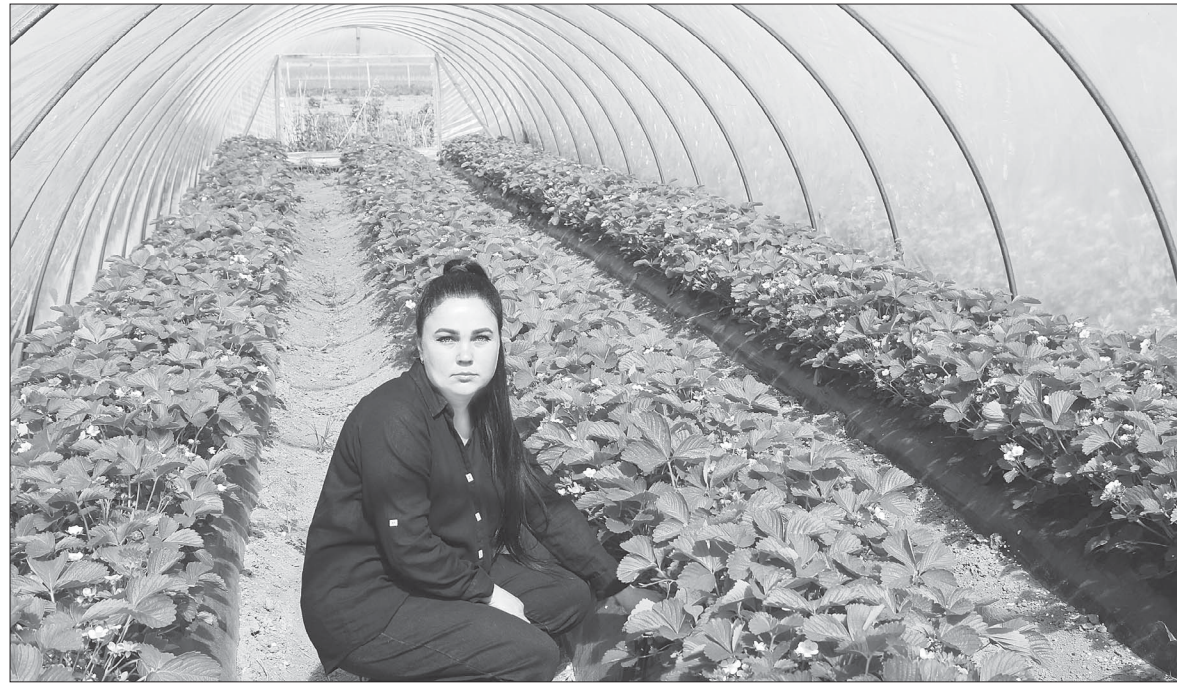
В самый разгар ягодного сезона особенно актуальна тема клубники - она стала настоящим хитом на фермерском рынке.

Формула успеха. Как работает программа государственных субсидий для ЛПХ в станице Петровской Славянского района