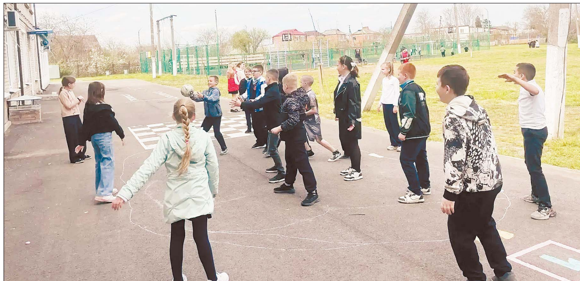
☞ Ребята из начальных классов быстро освоили мордовскую народную игру «Круговой».