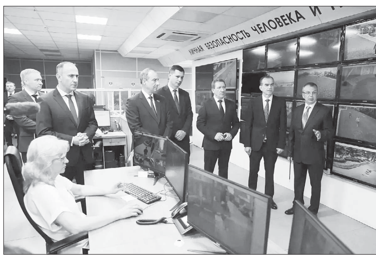
Вениамин Кондратьев проинспектировал работу Единой дежурной диспетчерской службы Геленджика. Сюда поступает информация с более 1,7 тысяч камер видеонаблюдения.

Безопасность наших гостей - это базовая задача и главный приоритет курортной политики. Для полной защищенности туристов введены антитеррористические требования к средствам раз-