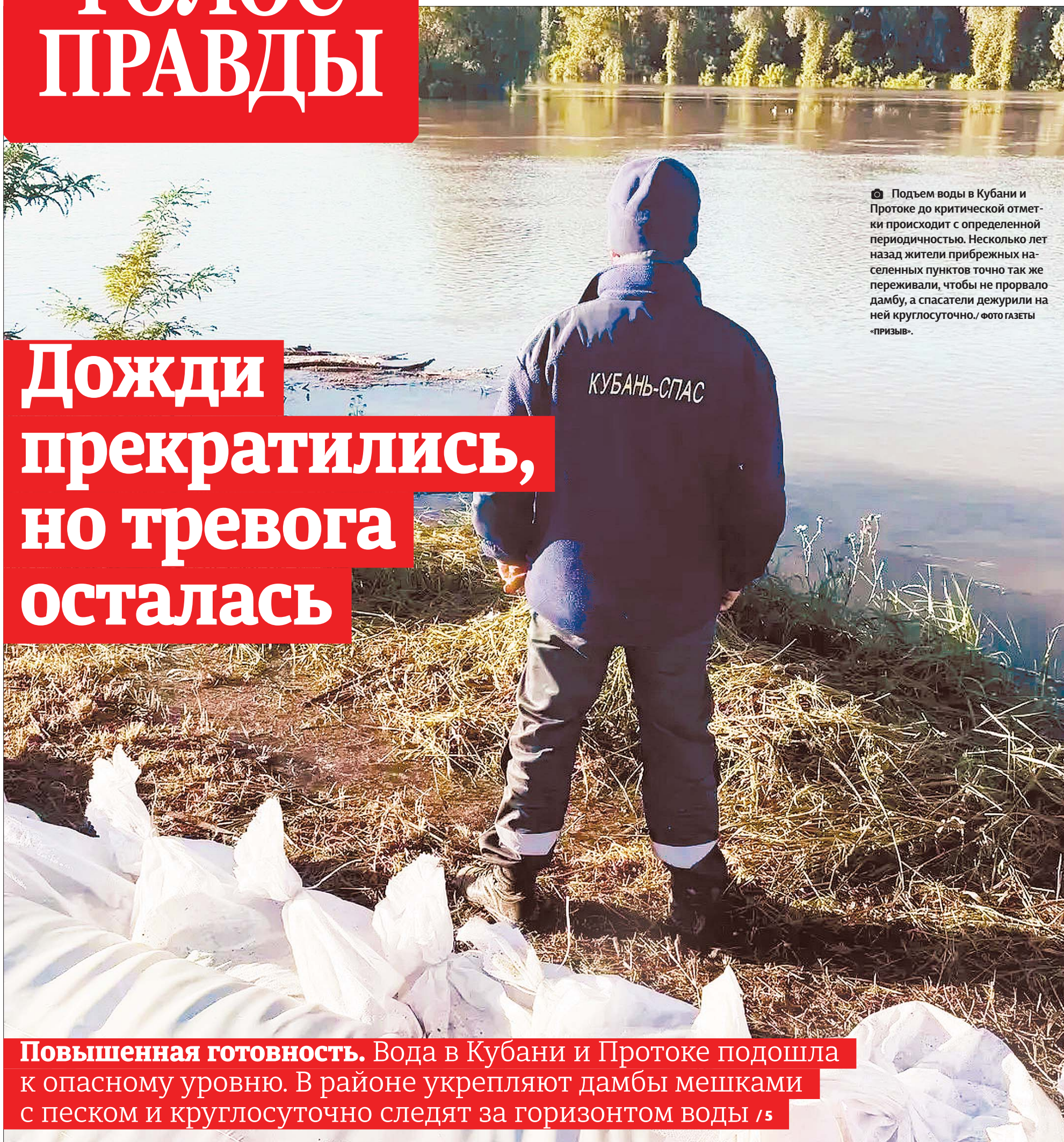
📷 Подъем воды в Кубани и Протоке до критической отметки происходит с определенной периодичностью. Несколько лет назад жители прибрежных населенных пунктов точно так же переживали, чтобы не прорвало дамбу, а спасатели дежурили на ней круглосуточно.

В полтавской СОШ №4 с 1 июня начался ремонт