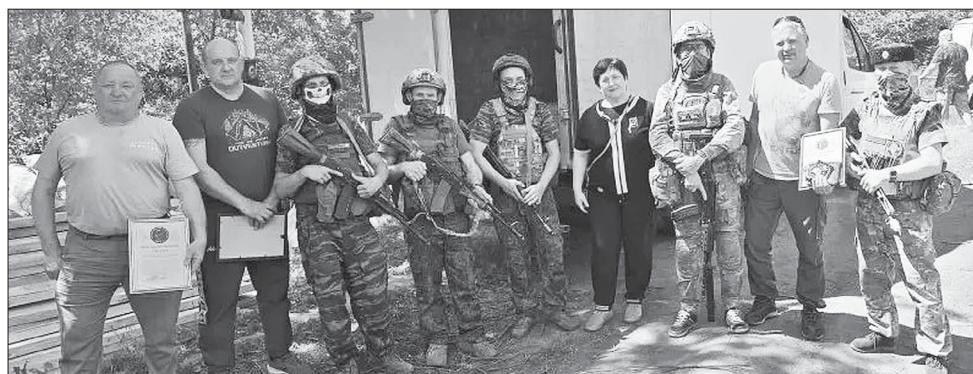
Сначала полтавские предприниматели Чуприны привезли гуманитарку бойцам, а следующим пунктом доставки были две школы-интернаты в ЛНР.

На днях братья Чуприны вернулись из очередной поездки к бойцам добровольческого отряда БАРС-18. Список переданного немалый: доска, ЮСБ, генераторы, утеплитель, кабель, полиэтиленовая пленка, строительный инструмент