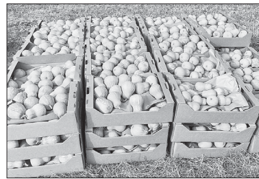
📷 Выращивание тыквы только кажется самым простым делом, хорошие семена, почва, полив играют важную роль.