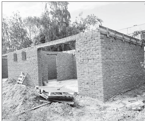
📷 В процессе ремонта и два теневых навеса в 27-м детском саду хутора Протички.