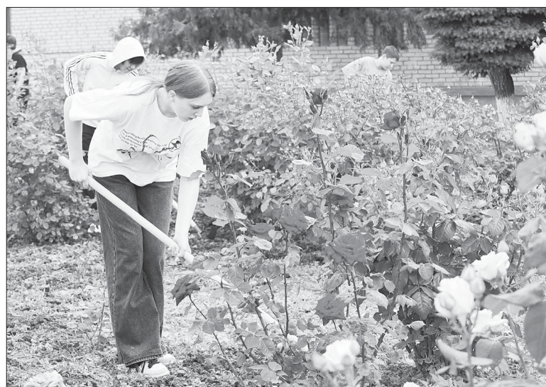
📷 Участники лагеря труда и отдыха «Росток» при СОШ №39 один из дней посвятили благоустройству школьной территории - пропалывали клумбы.

Безопасный отдых. 19 пришкольных лагеря открылись в Красноармейском районе с приходом лета