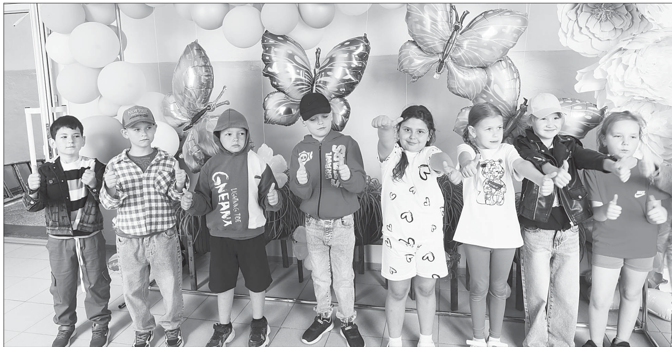
📷 В школе №39 хутора Трудобеликовского распахнули свои двери сразу два лагеря: «Солнышко» и «Росток». Для всех участников предусмотрено полноценное питание, а каждый день наполнен полезными и интересными мероприятиями.