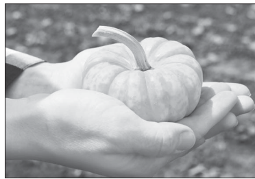
📷 Тыкву собирают бережно, хранят в ящиках и перекладывают бумагой.

министерство сельского хозяйства и перерабатывающей промышленности Краснодарского края. Здесь назначили дату защиты проекта. Собрались 45 претендентов, из них после презентации своего бизнес-плана отобрали 15 человек, которые и получили грант по программе «Агρο-старт ап». Среди них были и Першины.